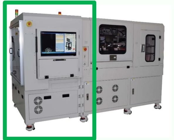
PI-100 連結 Printer